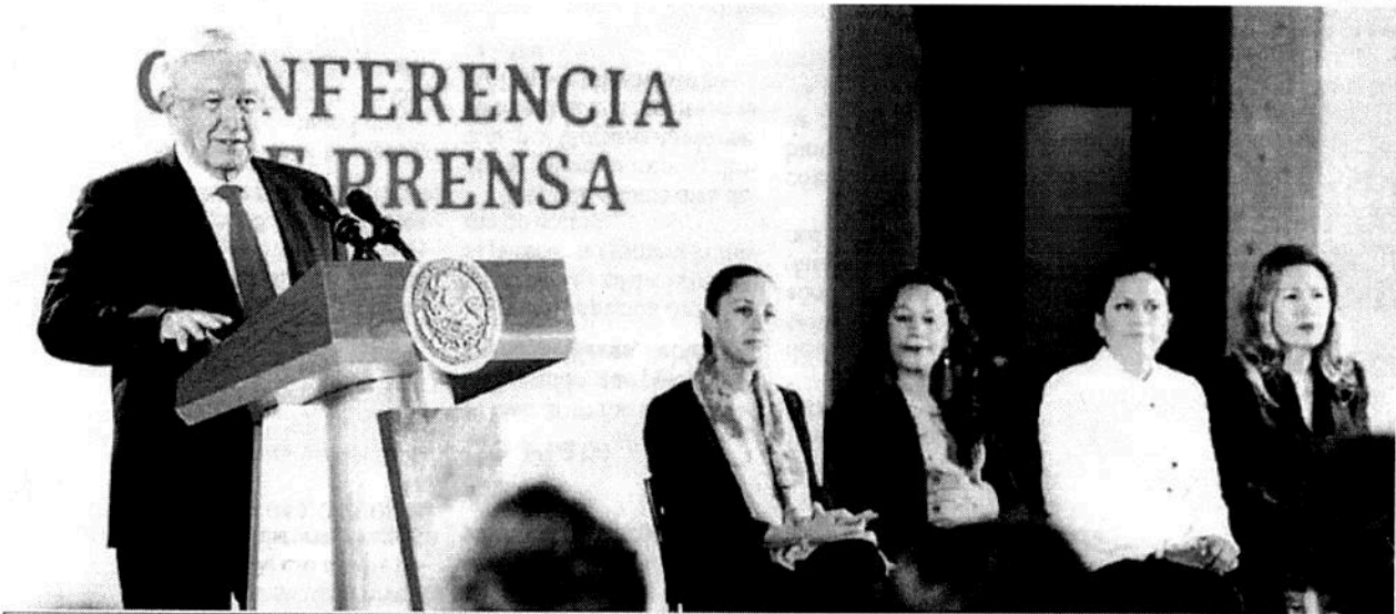
El Presidente Andrés Manuel López Obrador, en conferencia en Palacio Nacional