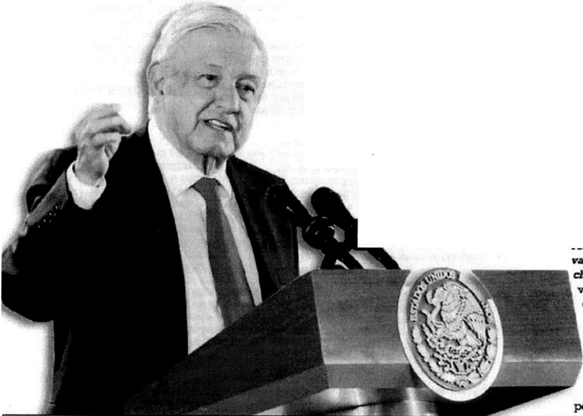
AMLO dijo que los adultos son muy importantes