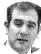
LORENZO CÓRDOVA Consejero presidente del Instituto Nacional Electoral

“Queremos una consulta seria y democrática; los mexicanos ya están cansados de las simulaciones, necesitamos un Presidente que respete la ley”