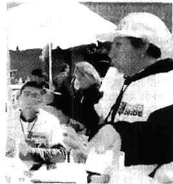
● Cuarto voto En el Metro Etiopía el sistema se les caía.