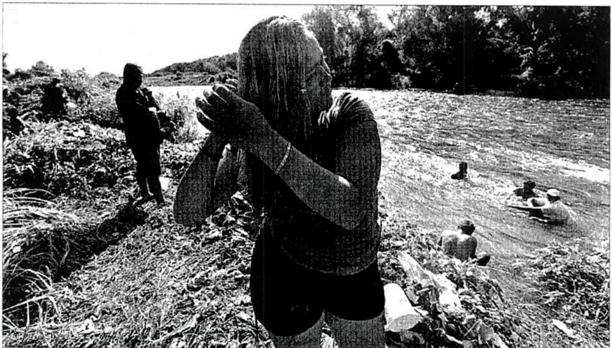
▲ A su arribo a Pijijiapan, los migrantes aprovecharon para descansar y asearse un poco.

Evo Morales: EU debe entender que no puede haber seres humanos ilegales