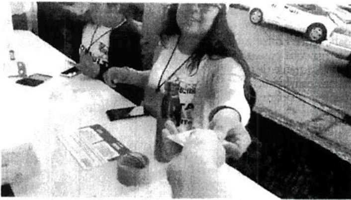
● Segundo voto Casilla en Metro Viaducto: no le revisaron el pulgar y tampoco se lo marcaron al emitir su sufragio.