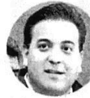
DAMIÁN ZEPEDA VIDALES Líder de la bancada del PAN en el Senado de la República

“Hay una campaña ahí en redes tratando de desprestigiar [la consulta]; incluso agarran una boleta y luego se presentan en otro lugar y la depositan como si estuviera votando en ese sitio”