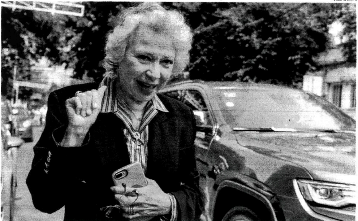
La futura secretaria de Gobernación expresó que es necesario cambiar la política prohibicionista.

"Ya no es posible continuar así, ya no es para seguirmos matando", advierte