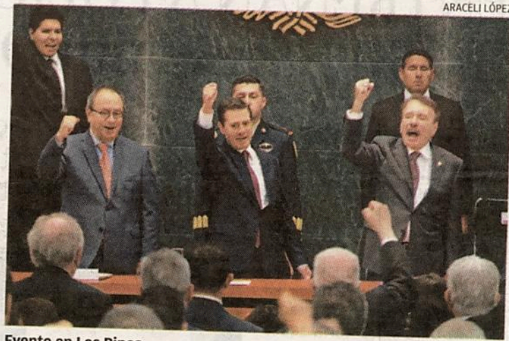
Evento en Los Pinos.

gunta de ¿qué tan mal estamos?, comentó que en su administración se logró la cifra récord de 3.6 millones de empleos.