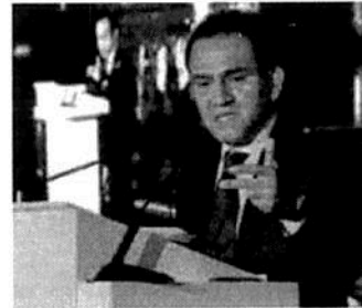
POLÍTICA CONTRACÍCLICA. Ayudaría a evitar altibajos, dijo el titular de la SHCP.