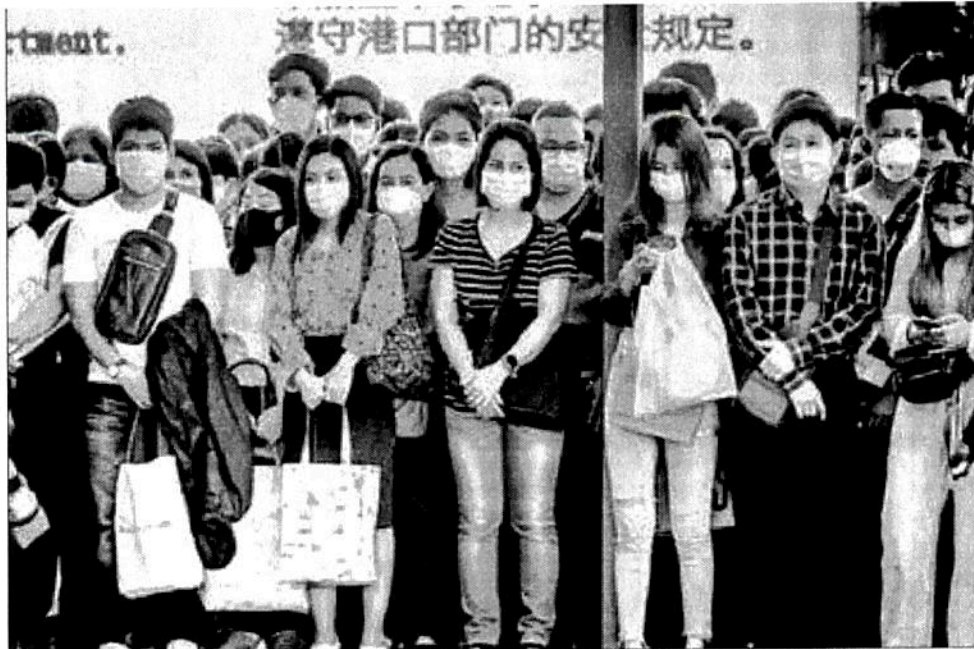
► En Bangkok, capital de Tailandia, pasajeros en espera de un bote para transportarse en el muelle de Pratunam.

Otros países tienen previstos dispositivos parecidos: Italia anunció el envío de un avión, España dijo que la evacuación se realizaría "en las próximas horas" y Berlín prevé el traslado de unos 90 alemanes en "los próximos días". Canadá también fletará un avión.