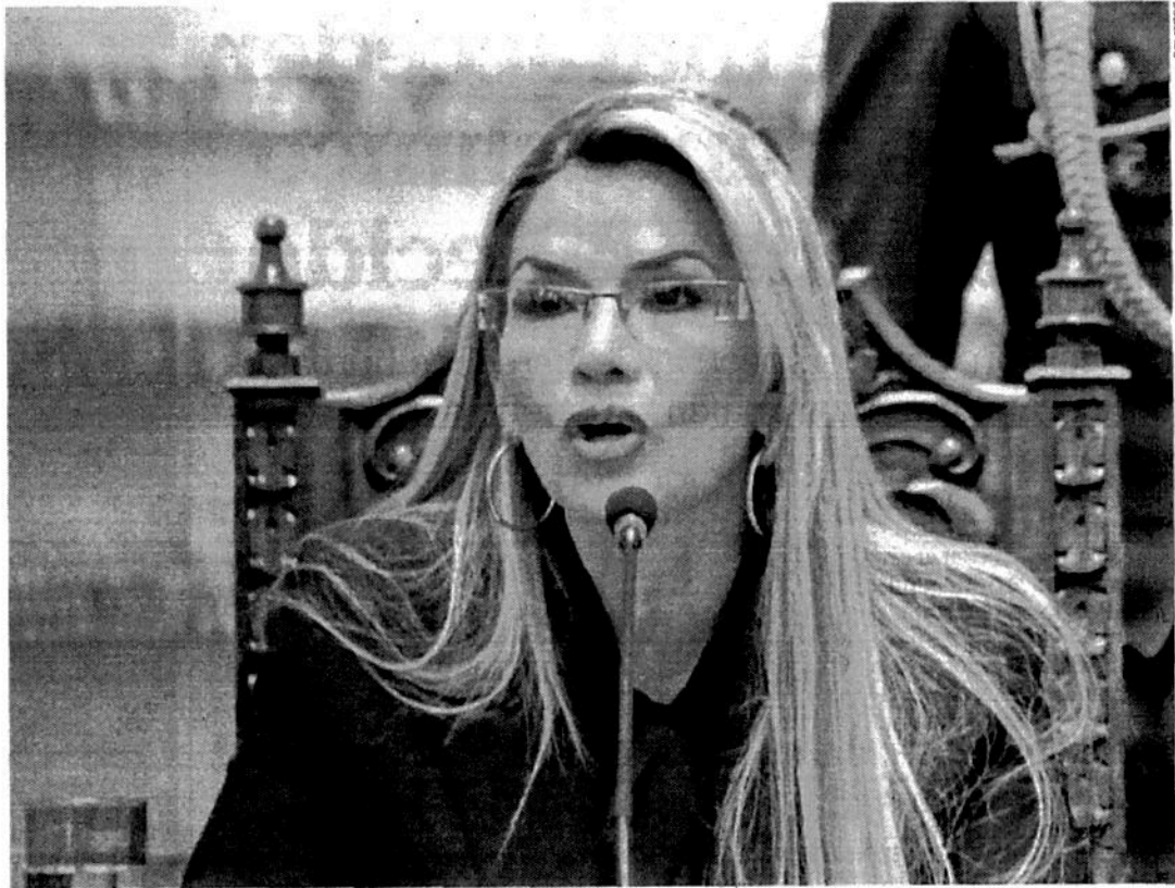
Jeanine Áñez, presidenta interina de Bolivia, dijo que la embajadora mexicana lesionó la soberanía del pueblo boliviano.