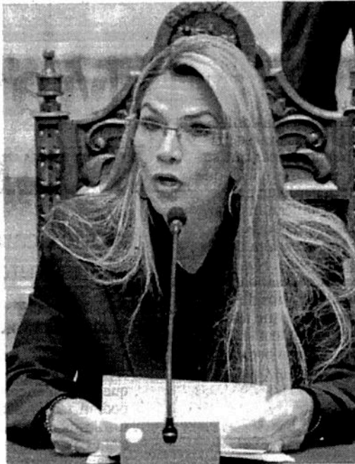
La presidenta Jeanine Áñez afirmó que representantes de México y España lesionaron la soberanía de Bolivia.