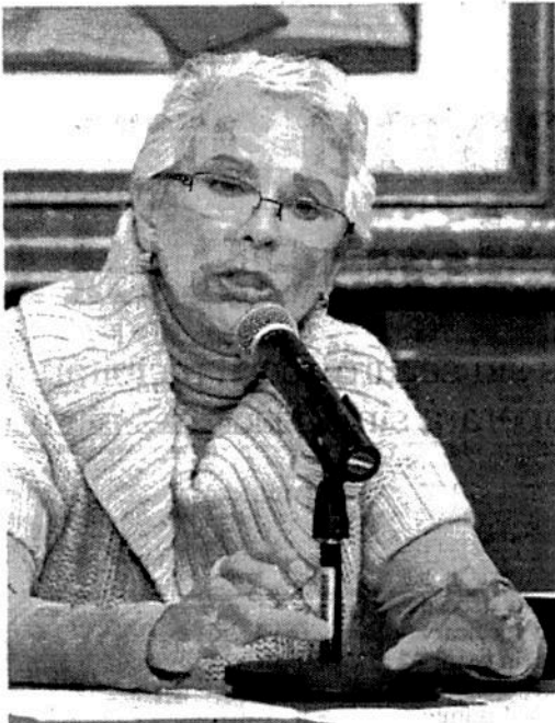
La titular de Gobernación, Olga Sánchez, dijo que aunque existe tensión no se piensa en romper relaciones.

La secretaria de Gobernación, Olga Sánchez Cordero, aseguró que el gobierno mexicano no tiene intención de romper relaciones diplomáticas con su similar de Bolivia.