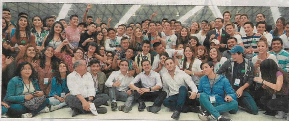
El presidente Peña en el Velódromo del Centro de Alto Rendimiento de la Conade.

Durante el encuentro con integrantes de la fundación Scholas, vinculada al papa Francisco, el Jefe del Ejecutivo expresó: “Nadie vendrá a hacer por nosotros lo que no seamos capaces de hacer nosotros mismos, lo que