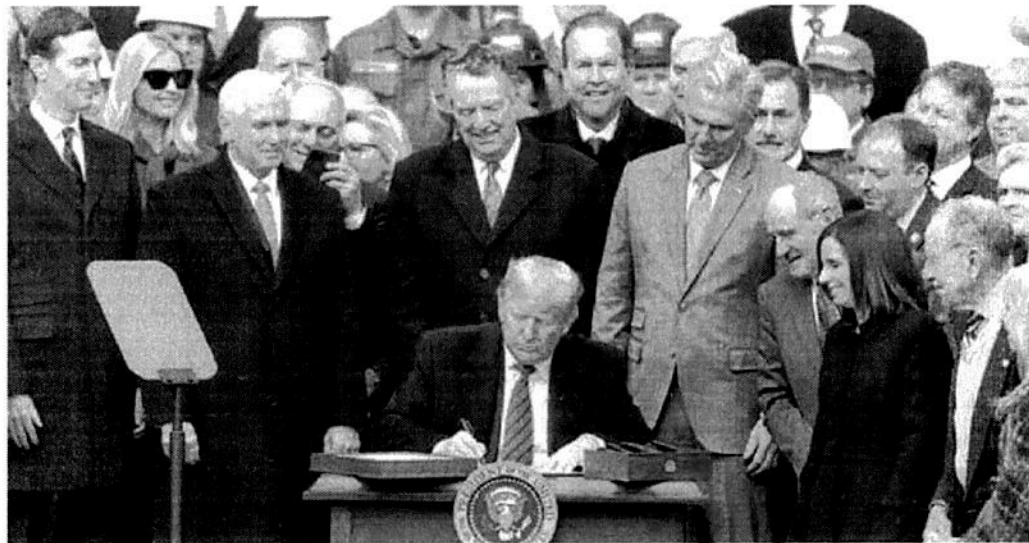
AVANZA. Ahora, el tratado comercial de América del Norte solo espera ser ratificado por el Poder Legislativo de Canadá.

FOCOS En un comunicado Robert Lighthizer felicitó a funcionarios