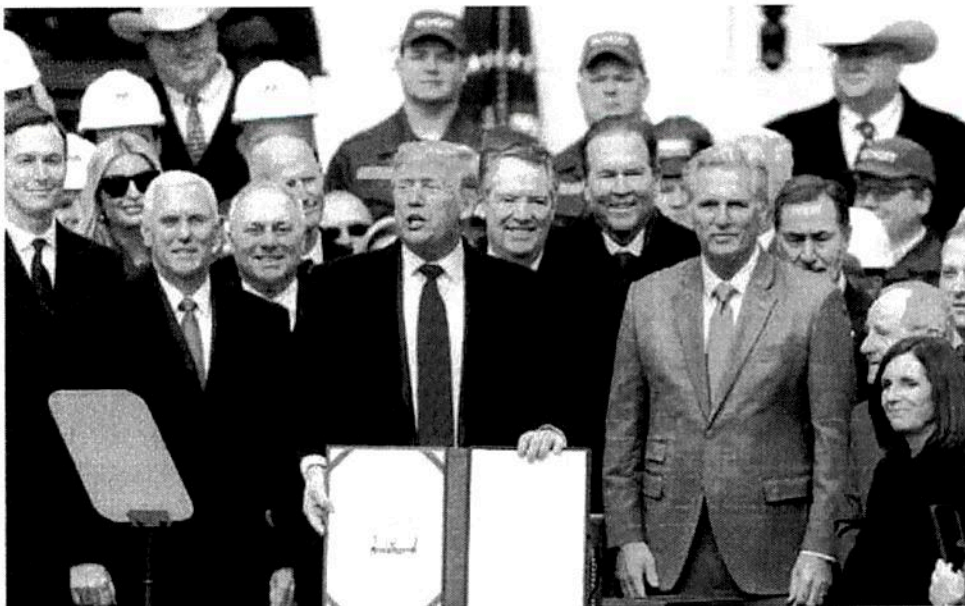
RATIFICACIÓN. Ahora sólo falta que el Parlamento canadiense apruebe el tratado para que pueda entrar en vigor.