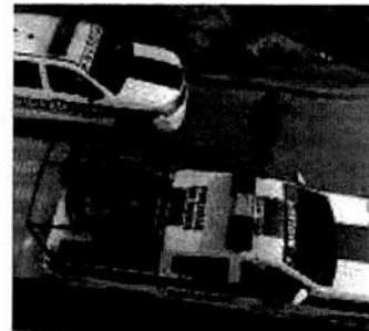
Elementos policíacos realizan rondines en las inmediaciones del sitio.