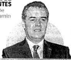
FRANCISCO CERVANTES Presidente de Concamín

La economía de México seguirá a flote, pero mantendrá el 'prolongado' periodo de bajo crecimiento y crecientes rezagos, si no se instrumenta una política industrial efectiva, alertó la Confederación de Cámaras Industriales.