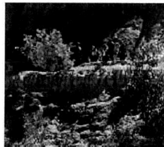
Desde la montaña hay cuadrillas que observan al personal mexicano.