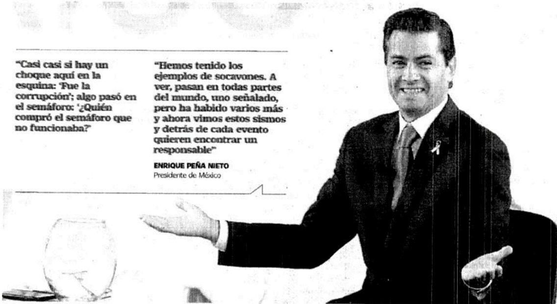
El presidente Enrique Peña Nieto clausuró el foro impulsando a México, en el Museo Nacional de Antropología e Historia.