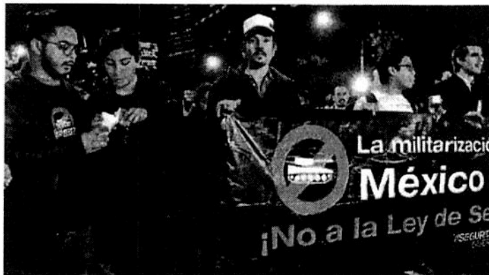
Diego Luna encabezó ayer una marcha del Ángel de la Independencia al Senado para pronunciarse en contra de la Ley de Seguridad Interior.

El Consejo Coordinador Empresarial se pronunció a favor de discutir la ley para enriquecer el diálogo y evitar malas interpretaciones.