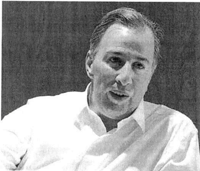
MEADE. Lo urgente: la inseguridad, corrupción y fortalecer la economía familiar.