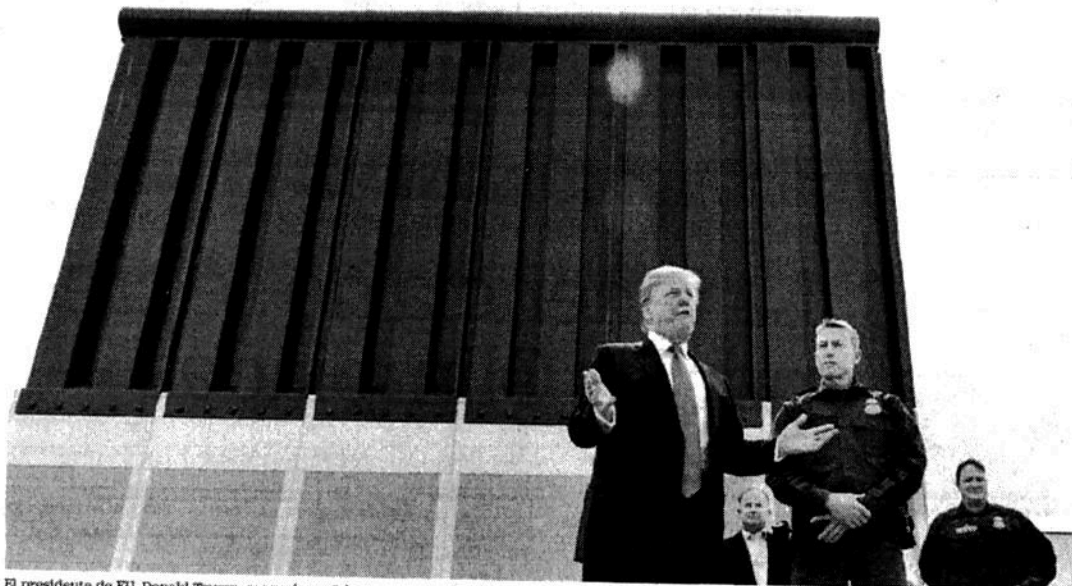
El presidente de EU, Donald Trump, aseguró que “sin un muro, no hay país”, durante la supervisión que hizo a los prototipos de la valla.

A pocos metros de territorio mexicano y rodeado de los prototipos del muro fronterizo, Trump, frente a un grupo de periodistas que le acompañó en la visita —entre los que estuvo EL UNIVERSAL—, alabó al presidente Peña Nieto, a quien consideró un “fantástico tipo” y un “buen negociador” con quien tiene una “magnífica” relación.