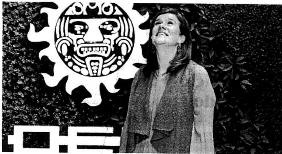
Afirmó que más del 90% de los mexicanos confía en una mujer para gobernar / MAURICIO HUIZAR

La próxima semana, Andrés Manuel López Obrador