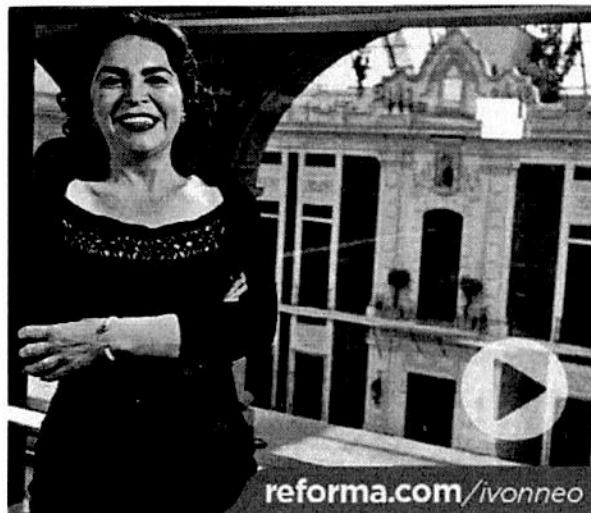
■ Ivonne Ortega, ex Gobernadora y aspirante presidencial, exige elección de candidato con voto de la militancia.

“Si la Asamblea no hace cambios de fondo que están pidiendo miles de militantes, determinaré qué voy a hacer”, puntualiza.