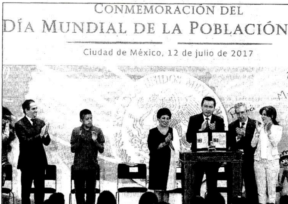
Miguel Ángel Osorio Chong señaló que el gobierno del presidente Enrique Peña Nieto decidió “retomar e impulsar” una política de población integral, además de una estrategia nacional para la prevención de embarazos en adolescentes, puesta en marcha en enero de 2015, con énfasis en la disponibilidad adecuada de anticonceptivos y de servicios de salud para este sector

EN 2013, CASI 400 MIL NACIMIENTOS DE MADRES MENORES DE 18 AÑOS