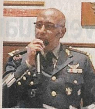
■ Eduardo León Trauwitz, General Brigadier

Hacking Team activó los permisos e inició planes de capacitación una vez que Pemex completó el pago, según consta en los más de 25 correos electrónicos localizados por Mexicanos Contra la Corrupción y la Impuni-