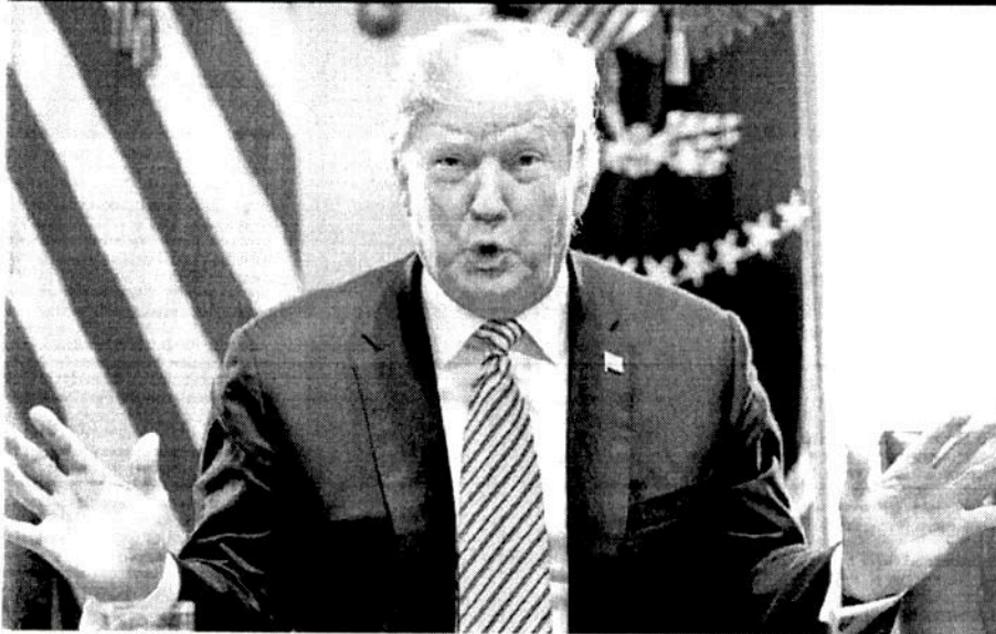
El presidente Donald Trump, ayer en la Casa Blanca. El republicano visitará hoy la ciudad fronteriza de Calexico, California.