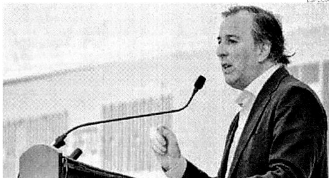
INTERCAMBIO. Ha caído bajo las reglas del TLCAN y aumentado bajo las de la OMC.