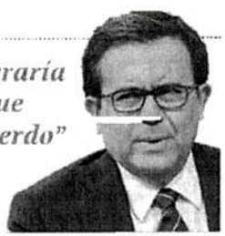
Ildelfonso Guajardo / SECRETARIO DE ECONOMÍA

“Discutir el tema del déficit generaría una guerra de proteccionismo que desmantelaría el avance del acuerdo”