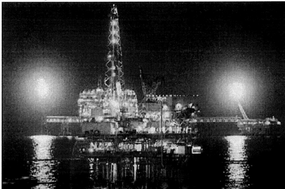
▲ Plataforma de Petróleos Mexicanos en la Sonda de Campeche.

La mitad de la energía del país proviene de ese