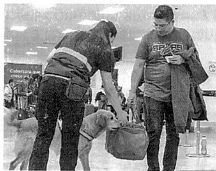
Binomios caninos inspeccionan maletas y personas en los aeropuertos.

La estrategia opera con países que se encuentran en cuarentena por la enfermedad de PPA y plagas como el Fusarium oxysporum f. sp. Cubense (Foc R4T), este hongo ha sido la enfermedad más destructiva de las musáceas y provocó una pérdida de 2 mil 300 millones