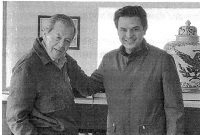
El titular del IMSS en una reunión con Porfirio Muñoz Ledo, ayer.

EL TITULAR DEL Instituto informó que 101 mil 335 profesionales se registraron en la bolsa de empleo; esperan que aumentando el personal se puedan hacer más cirugías en 2020