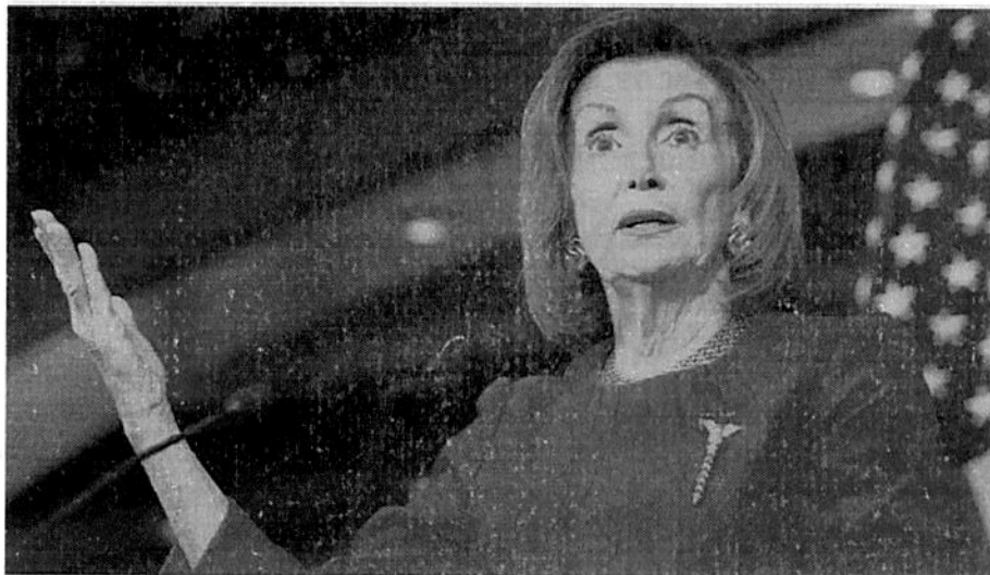
Nancy Pelosi , presidenta de la Cámara de Representantes de Estados Unidos.

CAPÍTULOS conforman el T-MEC, que retomó mucho del contenido de su antecesor, el TLCAN.