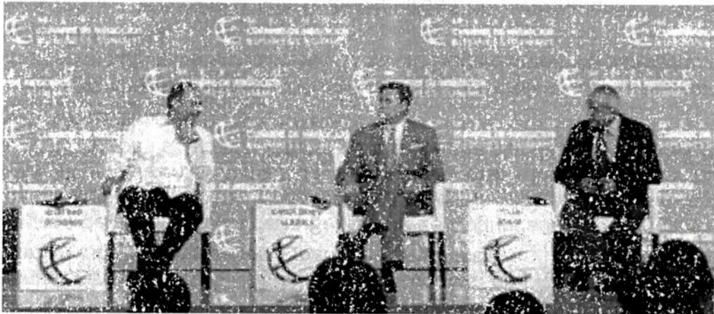
CONFERENCIA. El presidente de la Coparmex, Gustavo de Hoyos, con el Embajador de EU y Jesús Seade, durante el evento.