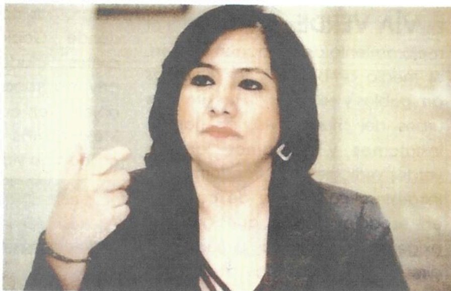
La secretaria de la Función Pública, Irma Eréndira Sandoval, señala que a la fecha hay casi dos mil investigaciones en curso y 502 inhabilitaciones.