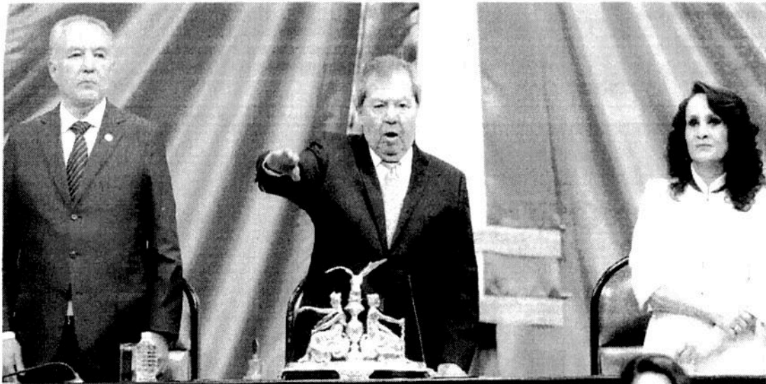
Porfirio Muñoz Ledo (centro) fue elegido como presidente de la Cámara de Diputados para el primer periodo de la 64 Legislatura. Como vicepresidentes quedaron Dolores Padierna, de Morena (der.), y Marco Antonio Adame, del PAN (izq.).

MARTÍ BATRES GUADARRAMA Presidente del Senado de la República