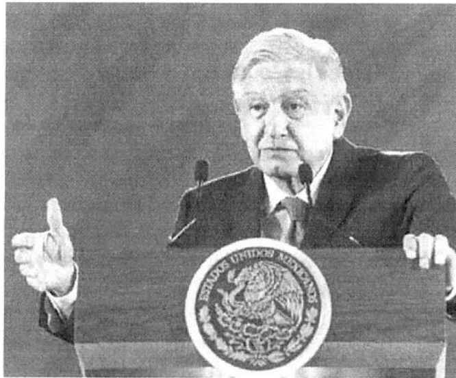
MENSAJE. Andrés Manuel López Obrador, ayer, en conferencia de prensa.

"No le tengo mucha confianza a esos organismos. Impusieron la política neoliberal. Deberían ofrecer disculpas"