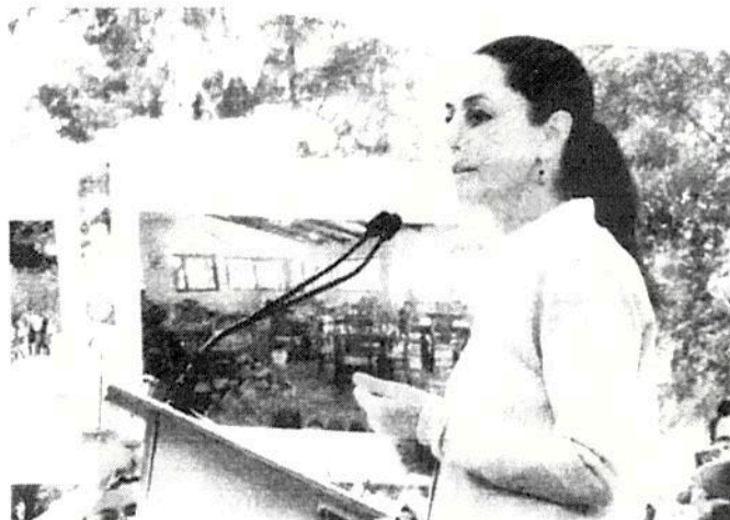
Claudia Sheinbaum dice que la procuraduría y a los jueces se encargarán del tema de la manipulación de cifras de delitos.