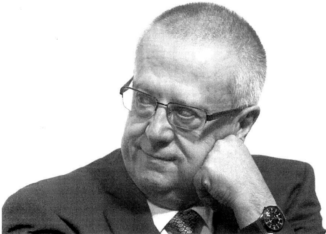
Carlos Urzúa, durante una rueda de prensa en 2017

México - 31 de agosto de 2019 - 08:40 CEST