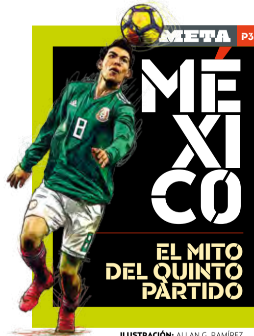
ILUSTRACIÓN: ALLAN G. RAMÍREZ