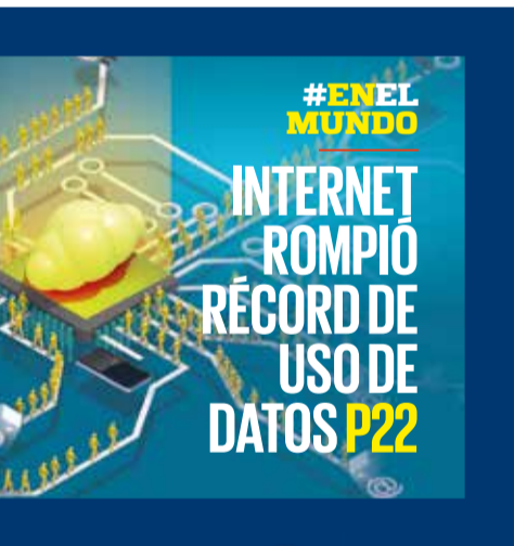
ILUSTRACIÓN: ARTURO RAMÍREZ

#HASTA165% MÁSCAROS PRECIOS DEL TREN MAYA, POR LOS CIELOS P23