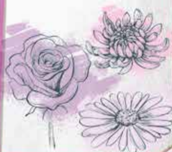
ILUSTRACIÓN: ALLAN G RAMÍREZ

El día más floreado, le compran al 50% a los productores