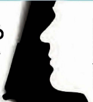
ILUSTRACIÓN: PAUL D PERDOMO

#MATANA48CANDIDATXS EN 2018, CRECIÓ 55% VIOLENCIA POLÍTICA P4