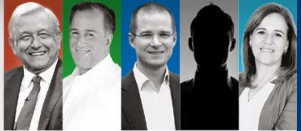
JAIME RODRÍGUEZ EL BRONCO | INDEPENDIENTE | 1%

FECHA DE LEVANTAMIENTO: DEL 21 AL 23 DE MARZO DE 2018 / POBLACIÓN DE ESTUDIO: MEXICANOS DE 18 AÑOS O MÁS / MÉTODO DE RECOLECCIÓN DE LA INFORMACIÓN: ENTREVISTAS CARA A CARA EN VIVIENDA. ERA REQUISITO QUE LA PERSONA ENTREVISTADA VIVIERA EN EL HOGAR SELECCIONADO Y QUE TUVIERA AL MENOS 18 AÑOS DE EDAD / MARCO MUESTRAL: LISTADO DE SECCIONES ELECTORALES DEL INSTITUTO NACIONAL ELECTORAL / TAMAÑO DE LA MUESTRA: 1,100 ENTREVISTAS EFECTIVAS / MÉTODO DE MUESTREO: POLIETÁPICO. EN LA PRIMERA ETAPA 8 CUESTIONARIOS POR SECCIÓN ELECTORAL / MARGEN DE ERROR Y NIVEL DE CONFIANZA: EN LA ESTIMACIÓN EL MARGEN DE ERROR TEÓRICO ES DE +/-3.1% CON UN NIVEL DE CONFIANZA DE 95% / PERSONAL INVOLUCRADO EN EL LEVANTAMIENTO: PARTICIPARON 1 COORDINADOR GENERAL, 7 SUPERVISORES Y 31 ENCUESTADORES. RESPONSABLE DE CAMPO: SUASOR CONSULTORES, SA DE CV