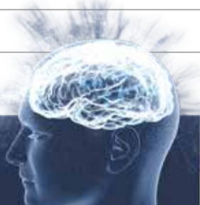
ILUSTRACIÓN: PAUL D PERDOMO