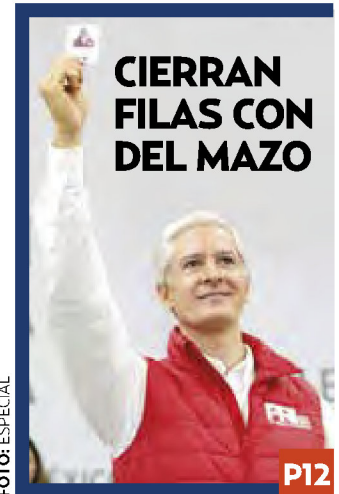
CIERRAN FILAS CON DEL MAZO