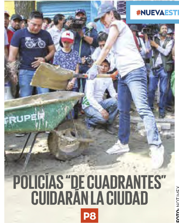
POLICÍAS "DE CUADRANTES" GUIDARÁN LA CIUDAD