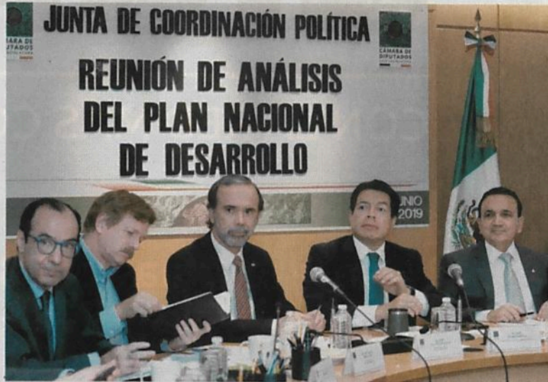
Empresarios solicitaron a la Cámara de Diputados más tiempo para analizar el Plan Nacional de Desarrollo, a fin de que cumpla con las metas.