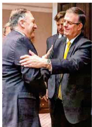
POMPEO Y EBRARD. Reconocen avances y hablan en términos amistosos.