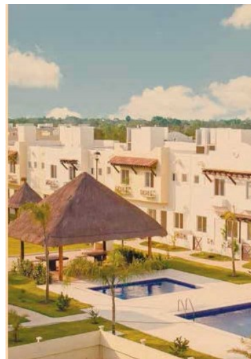
Inmobiliaria Vinte anunció cambios en su equipo directivo.

Por cierto muy reconocida dentro del sector de fideicomisos de inversión en bienes raíces.