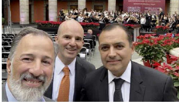
José Antonio Meade, José Antonio González Anaya y Ernesto Cordero durante el concierto de fin de año.