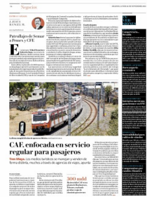
CAF, enfocada en servicio regular para pasajeros El servicio de pasajeros de CAF en la línea de ferrocarril de alta velocidad de la zona de México, muestra a un tren de pasajeros en movimiento.