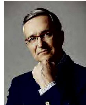
RICARDO SALINAS PLIEGO

CON EL VÉRTIGO TECNOLÓGICO EL CONTACTO CON LAS AUDIENCIAS SE HA SOFISTICADO