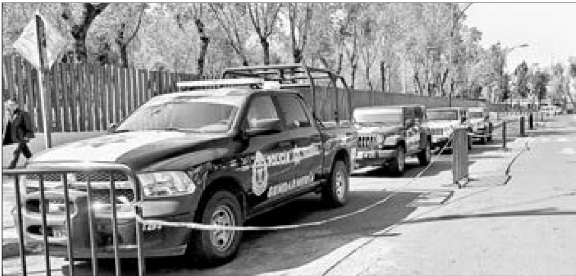
En vísperas de que Andrés Manuel López Obrador tome posesión de la Presidencia de la República, agentes de la gendarmería realizan maniobras de seguridad en San Lázaro.