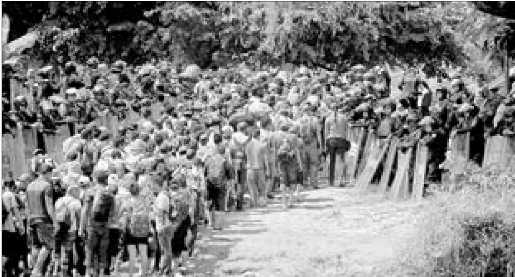
Un contingente de 2 mil centroamericanos cruzó el río Suchiate para llegar a México.

Facebook, Twitter: galvanochoa Correo: galvanochoa@gmail.com