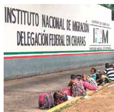
DEREGRESO. En junio, las estaciones del país recibieron 29 mil 153 personas.

► DEFENSA DE MEXICANOS HABRÁ PROTECCIÓN ANTE DEPORTACIONES MASIVAS EN EU. / PÁG. 41