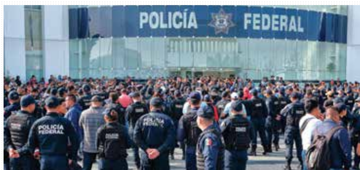
DOS GRUPOS. La división entre los elementos de la PF se agudizó ayer.

► CENTRO DE MANDO MÁS DE MIL 200 VEHÍCULOS DE LA PF, 'ESTACIONADOS' NACIONAL / PÁG. 36