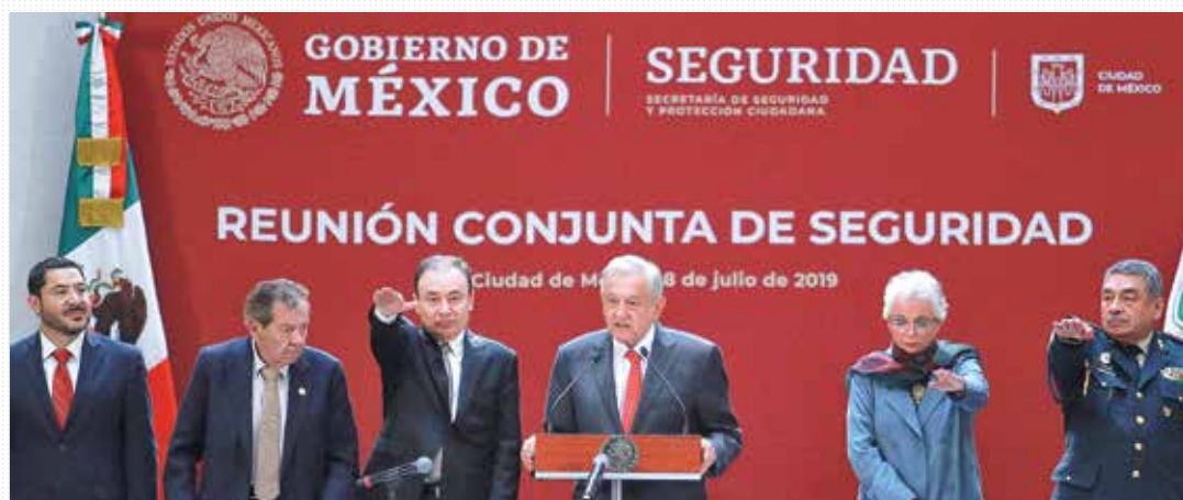
SEGURIDAD. Pide el presidente apoyo a gobernadores, legisladores, la CNDH, sociedad civil y cuerpos de seguridad.