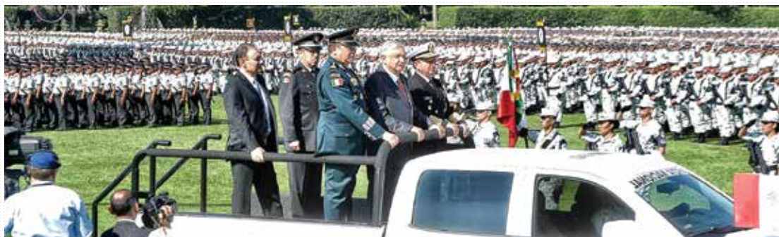
GUARDIA NACIONAL. El mandatario encabezó el despliegue de 70 mil elementos en 150 regiones del país.

SE MANIFIESTAN CONTRA AMLO EN VARIAS CIUDADES. PÁG. 50