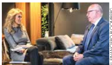
EL FINANCIERO BLOOMBERG