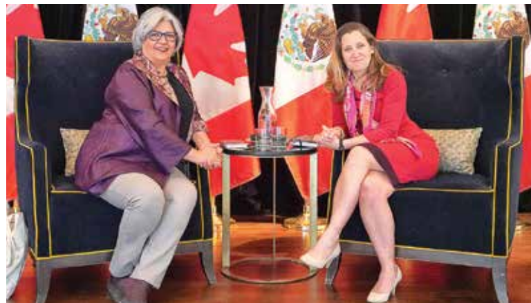
DE LOBBY. Chrystia Freeland va hoy a Washington a reunirse con Robert Lighthizer.

En Toronto, acompañada por la ministra de Asuntos Exteriores de Canadá, Chrystia Freeland, y por Jesús Seade, subsecretario para