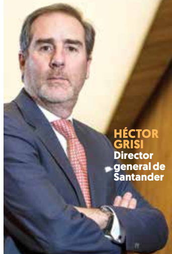
HÉCTOR GRISI Director general de Santander

► BARCLAYS MÉXICO BANCA SE ADAPTA AL NUEVO ENTORNO: MARTÍNEZ OSTOS ECONOMÍA / PÁG. 9