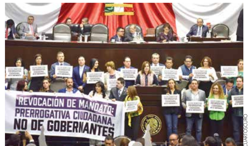
ENTRUBUNA. Con cartulinas, la bancada de MC manifestó su voto en contra.

HACE EL CONGRESO DE LA UNIÓN LA DECLARATORIA DE CONSTITUCIONALIDAD Y REMITE REFORMAS AL EJECUTIVO PARA SU PROMULGACIÓN. NACIONAL / PÁG. 50