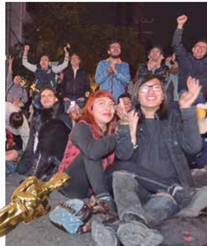
DESDE LA ROMA POR ROMA. En la plaza Río de Janeiro se reunieron cinéfilos a ver la entrega de los Premios Oscar.