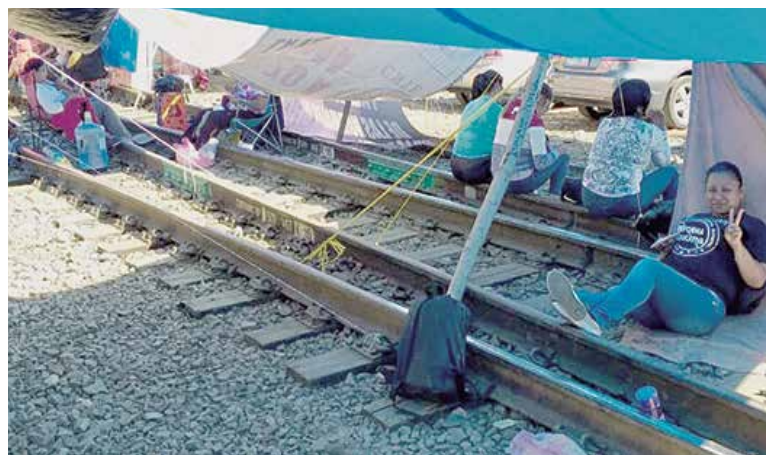
BLOQUEO. Maestros de la CNTE impiden hace 11 días el movimiento de mercancías.

— A. Clemente / A. Estrada / PÁGS. 40 Y 41