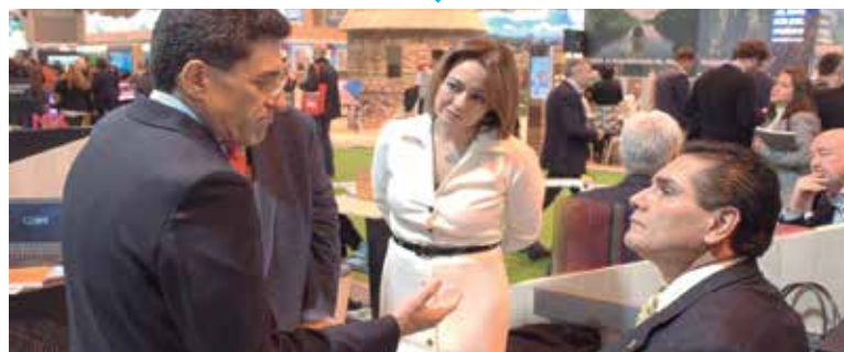
SILVANO AUREOLES está en España para promocionar Michoacán, en medio de una crisis con el magisterio estatal, que le exige la nómina.