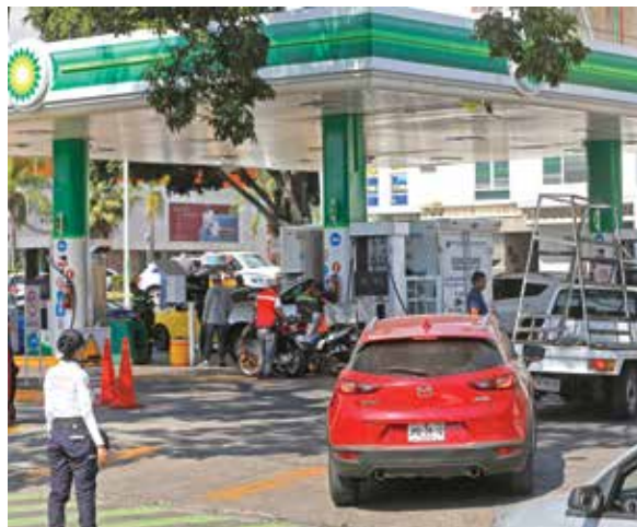
MÁS FILAS. Inicia la escasez en varias ciudades del país ante el cierre de ductos, la falta de pipas y las compras de pánico.