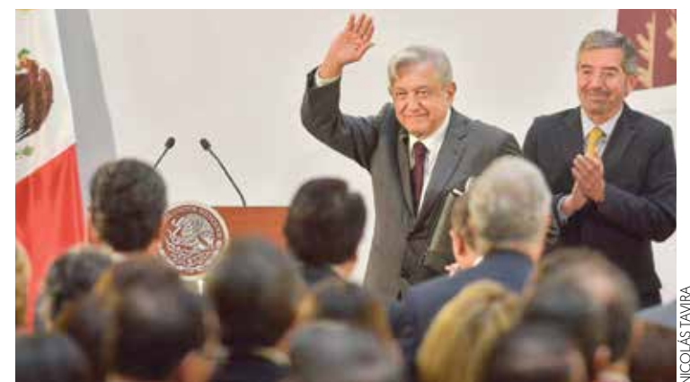
MURO. El presidente reiteró que no responderá a los comentarios de Trump.