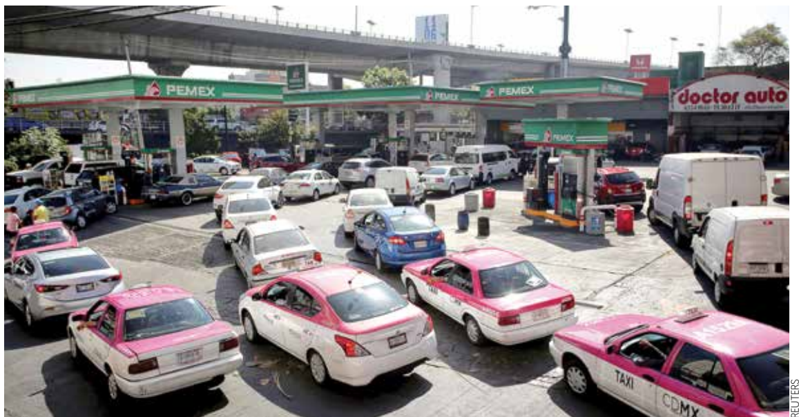
CDMX. Ayer amanecieron cerradas 103 gasolineras, pero tras recibir pipas reabrieron 18, quedando 85 sin operar.

Respecto a las tasas de interés, dijo que aunque estén un poco altas, no las consideran un obstáculo para el crecimiento. Informó que planean mantener las coberturas petroleras. — Redacción / PÁG. 4