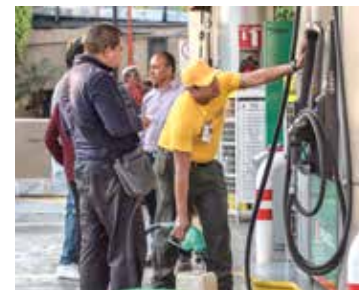
ESCASEZ. Automovilistas siguieron llegando a las estaciones con bidones.

to en la actividad económica y en los precios agrícolas.