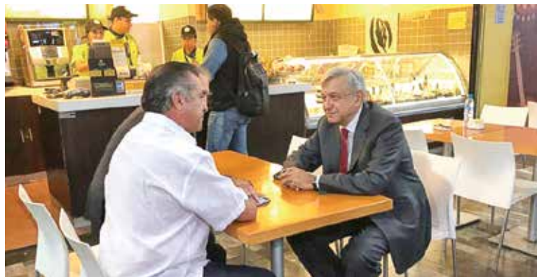
REENCUENTRO. Jaime Rodríguez, gobernador de NL, recibió al presidente electo.