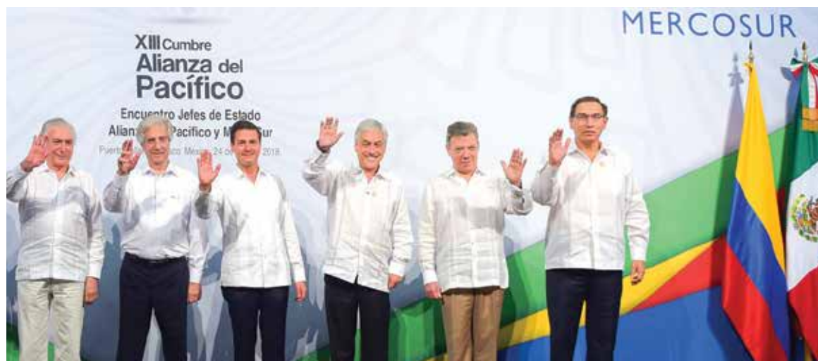
FORTALECEN RELACIÓN. Pactan presidentes favorecer la inclusión social, mayor cooperación y comercio en la región.