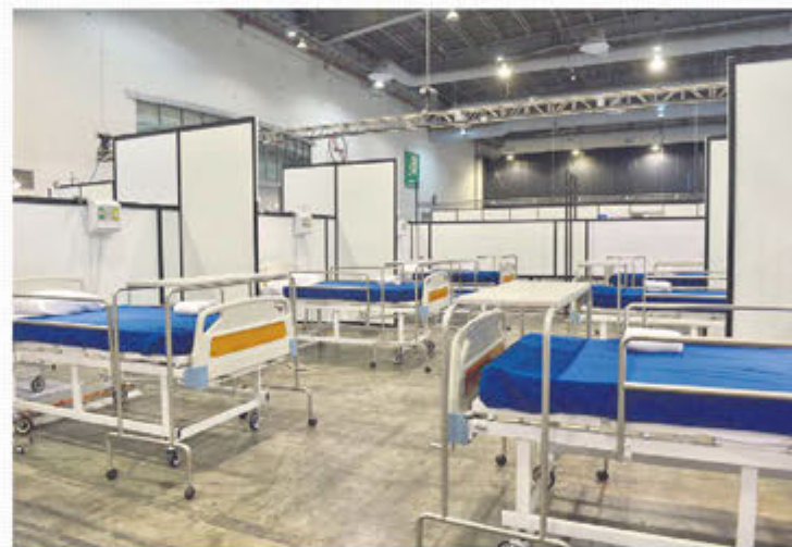
INICIA EL LUNES. Inauguran Unidad Temporal Covid en Centro Citibanamex.